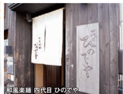
和風楽麺 四代目 ひのでや