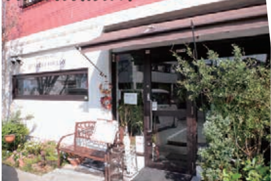
クワトロ・フォリオ(イタリアン)

大宮や浦和、さらに池袋や新宿、東京など都心のターミナルとも30～40分台で直結する「蓮田」。市内には元荒川がゆったりと流れ、緑豊かな公園もたくさんあります。また大型の商業施設とともにママの嬉しいカフェやグルメも点在。とても暮らしやすい街ですよ。