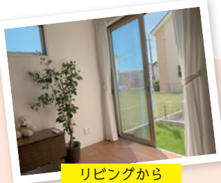
リビングから 外を眺める