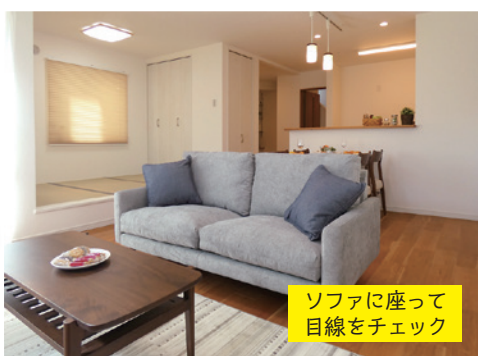
ソファに座って 目線をチェック

ーやテーブル。インテリアとして眺めるだけでなく、必ず座るようにしましょう。そして視線をダイニングやキッチン、屋外などへ向け、そこからの光景が自分にとって心地よいかを確かめます。キッチンからは、特にリビングがちゃんと見えるか、家事をしながら遊んでいるお子様が見えるか、などもチェックしましょう。目線は設計者もプランニング時に特に重視するほど、快適な暮らしにとって重要な要素なのです。