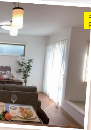
キッチンからの 目線も重要です

ーやテーブル。インテリアとして眺めるだけでなく、必ず座るようにしましょう。そして視線をダイニングやキッチン、屋外などへ向け、そこからの光景が自分にとって心地よいかを確かめます。キッチンからは、特にリビングがちゃんと見えるか、家事をしながら遊んでいるお子様が見えるか、などもチェックしましょう。目線は設計者もプランニング時に特に重視するほど、快適な暮らしにとって重要な要素なのです。