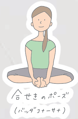
合 せきのポーズ (パッドマナーサナ)