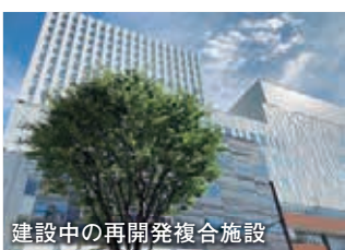
建設中の再開発複合施設