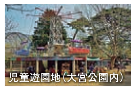
児童遊園地(大宮公園内)