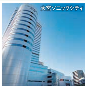
大宮ソニックシティ

れた施設の中で、親子で楽しめるようなのが「宇宙劇場」。JACK大宮内にあり、様々な番組が投影されるプラネタリウムは子ども達に大人気です。このように駅を中心にコンパクトに「買う」「知る」「遊ぶ」「食べる」がバランスよく揃うのも、大宮の魅力といえそうですね。