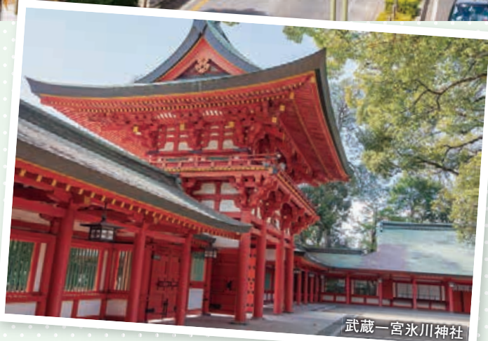
武蔵一宮氷川神社

調査対象：関東圏(東京都、神奈川県、埼玉県、千葉県、茨城県)在住の20歳～49歳の男女を対象に、インターネットによるアンケート調査を実施。 1都4県(東京都、神奈川県、埼玉県、千葉県、茨城県)にある駅の中から「住んでみたい街(駅)」1位～3位を回答してもらい、1位＝3点、2位＝2点、3位＝1点と配点してランキングを算出 本調査期間：2021年1月4日(月)～2021年1月15日(金) 本調査有効回答数：7,000人