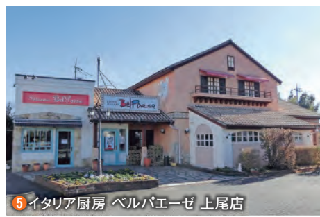
5 イタリア厨房 ベルパエーゼ 上尾店