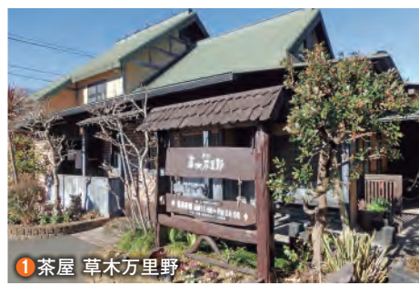
1 茶屋 草木万里野