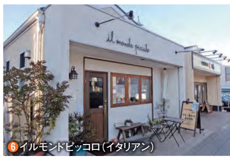
6 イルモンドピッコロ(イタリアン)