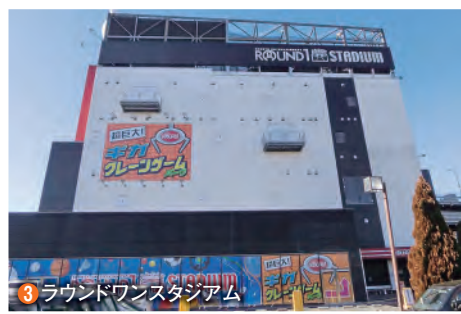
3 ラウンドワンスタジアム