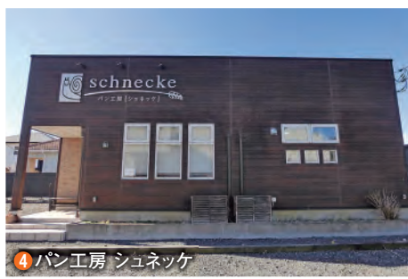
4 パン工房 シュネッケ