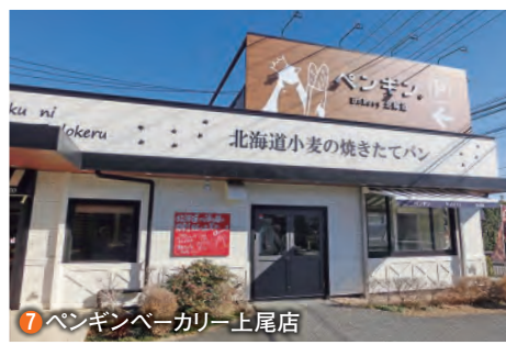
7 ペンギンベーカリー上尾店

陸上競技場の外周には、ウレタン舗装された脚にやさしい1周800mのジョギングコースがあります。