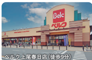
ベルク上尾春日店 (徒歩9分)