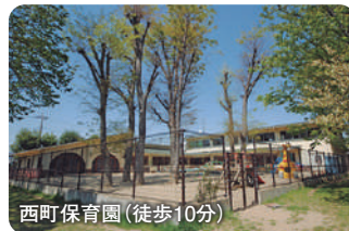
西町保育園 (徒歩10分)