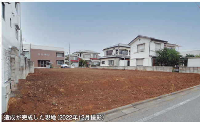
造成が完成した現地 (2022年12月撮影)