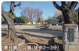
春日第一公園 (徒歩2~3分)

環境チェック 保育園と公園が徒歩3分と、これから子育てをお考えのご家族に嬉しい環境。ICT環境の充実する上尾市の小学校の中でも、学区の富士見小は教室と廊下の境がなく、オープンな教育方針が人気です。