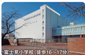
富士見小学校 (徒歩16~17分)

【ご返済例：3号棟5,280万円をご購入の場合】月々のお支払額136,362円 (頭金なし・ボーナス時加算なし・借入金 / 5,280万円・金利(変動) / 0.47%・借入期間 / 35年・金融機関 / 埼玉りそな銀行) ※建物面積 / 3号棟：ビルトイン面積4.97㎡含む