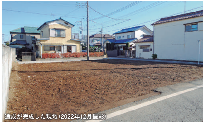
造成が完成した現地 (2022年12月撮影)