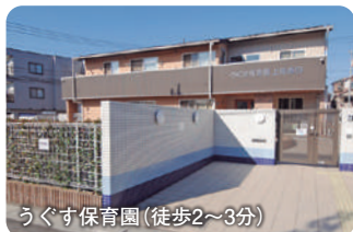
うぐす保育園 (徒歩2~3分)