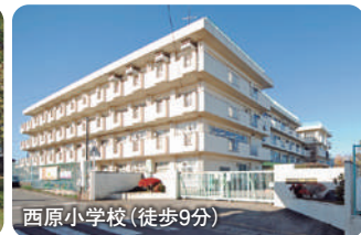
西原小学校 (徒歩9分)

環境チェック 保育園、小学校、大型公園が徒歩10分圏内。徒歩11分のフェスタスクエアは、スーパーのヤオコーやダイソー、スギ薬局、書店の文芸堂などがあって便利です。子育てにぴったりなエリアですね。