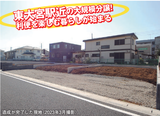
造成が完了した現地(2023年3月撮影)