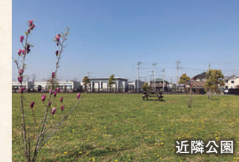
一部オープンした約1万㎡の近隣公園。原っぱのような広大な空間で、思いっきり体を動かせます！

「一度は見に行きたい日本の桜名所&名桜700景」に選出されている元荒川の桜並木。両岸2.5km・500本にもおよぶ桜は、春になると美しく咲き競い、華やかな姿を水面に映し出します。