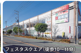
フェスタスクエア (徒歩10~11分)