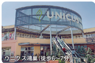
ユニクス鴻巣(徒歩6～7分)