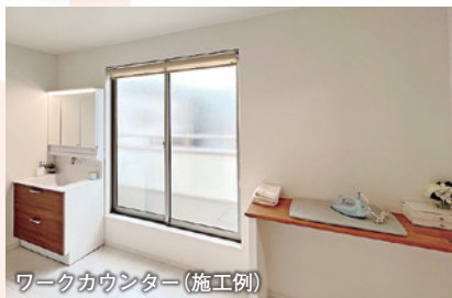
ワークカウンター(施工例)