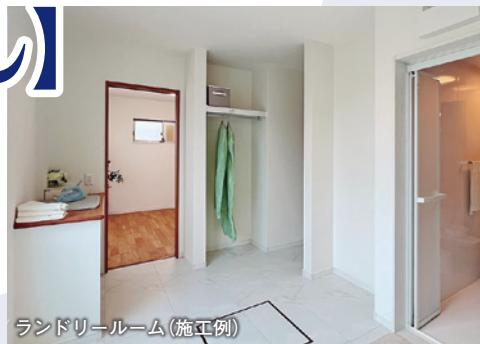
ランドリールーム(施工例)

賃貸住宅では夜、洗濯機を回すのは難しいものです。遠慮なく回せるのは一戸建てならではの特権。家族全員が入浴した後なら残り湯も使えて経済的ですね。洗濯が終わったら、そのままランドリールームに干しておきます。翌朝にはタオルなどは乾いているので、身支度の時そのまま使えばこちらも家事の時短に繋がりますね。