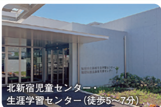
北新宿児童センター・生涯学習センター(徒歩5～7分)