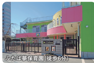
ふたば夢保育園(徒歩6分)