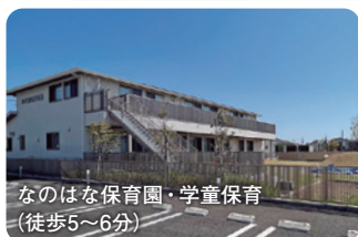
なのはな保育園・学童保育(徒歩5～6分)

整然とした区画整理地内には保育園や学童保育、児童センターなど子育てをサポートする施設が充実。ユニクス鴻巣を中心にロードサイドショップも点在しています。