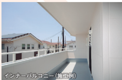
インナーバルコニー(施工例)

昨夜のうちに洗濯してランドリールームに干した洗濯物は、そのまま室内で干し続けるもよし、外に干してもよし。ネライフは2階浴室なので、ランドリールームも2階にあります。バルコニーと同じ階なので階段の上り下りもありません。ランドリールームとバルコニーが直結したプランも多く、内に干すか外に干すかお天気や洗濯物の種類、その日の行動などで決めることができます。まさに室内・屋外干しの二刀流といえそうですね。もし、夜のうちに洗濯機を回せない環境なら、ただでさえ忙しい朝の時間帯がより慌ただしくなりそうです。