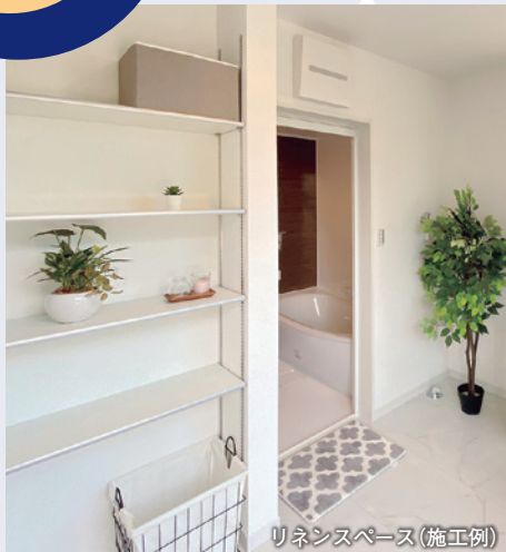
リネンスペース(施工例)

バルコニーで取り込んだ洗濯物を和室などへ運んでたたみ、脱衣室や他の部屋へ配る手間を考えると、いかに家事の時間を短縮できるかがわかります。共働きのご夫妻にとってこれは助かりますね。お子様が少し大きくなったら、一緒にたたんでしまうことで教育的な効果も望めそうです。