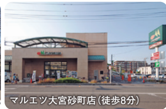
マルエツ大宮砂町店(徒歩8分)