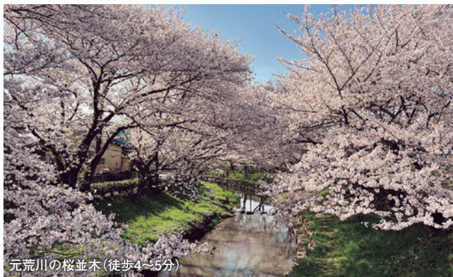
元荒川の桜並木(徒歩4～5分)