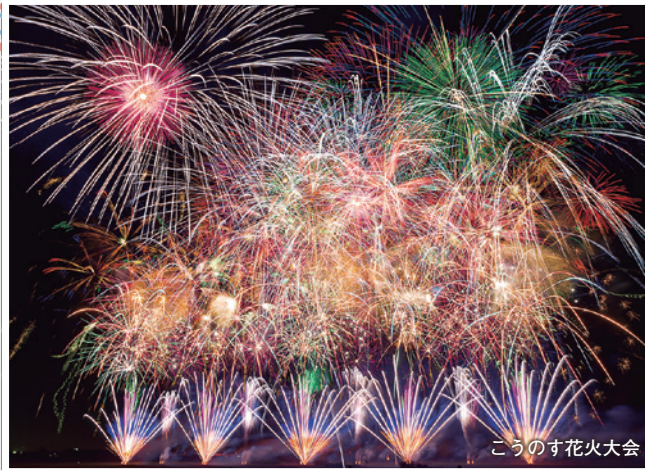
こうのす花火大会

秋に開催される、世界一重い4尺玉(2014年ギネスブックに認定)を打ち上げることで有名な花火大会。3尺玉2発も打ち上がり、さらに日本一のラストスターメインと呼ばれる尺玉300連発で構成されるショー「鳳凰乱舞」も圧巻です。