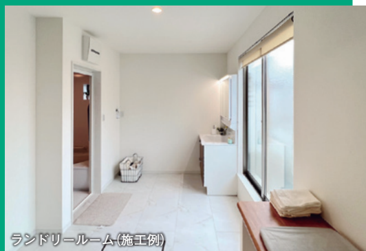
ランドリールーム(施工例)

花粉やPM2.5、紫外線による衣服へのダメージ防止などにより、最近は室内干し派も増えているそうです。とはいえ、お日様の光をたっぷり浴び、カラッと乾いた良い香りのする仕上がりも捨てがたいですね。三井開発・ネライフのランドリールームなら、室内干し屋外干し、どちらも対応できます。気になる方は、ぜひお問合せください。