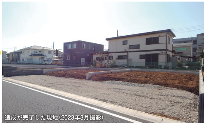
造成が完了した現地(2023年3月撮影)